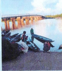
สำหรับคน

แหล่งหาปลาน้ำจืดในแม่น้ำสงคราม ซึ่งมีปลาน้ำจืด หลากหลายชนิด เช่น ปลาแขยง ปลาน้ำจืด (ปลานาง) ปลาขาว , ปลาตะเพียน ,ปลารากกล้วย และอื่น ๆ และยังเป็นจุดรับซื้อขายปลาที่สำคัญของอำเภอ อากาศอำนวย และนอกจากนี้ยังมีการแปรรูปปลา เช่น ปลาแดดเดียว ปลาสาม ปลาห้า