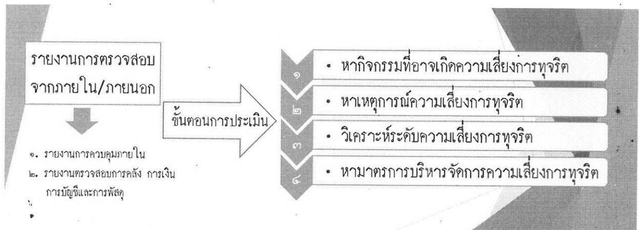
รูปภาพแผนผังขั้นตอนการประเมินความเสี่ยงการทุจริต

ขั้นที่ ๔ การหามาตรการบริหารจัดการความเสี่ยงการทุจริต หาแนวทาง/กิจกรรมที่สามารถขจัดความเสี่ยงการทุจริตออกไปให้หมด